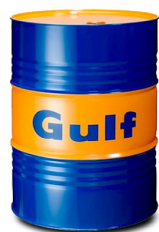
Cilindro de 400 lbs